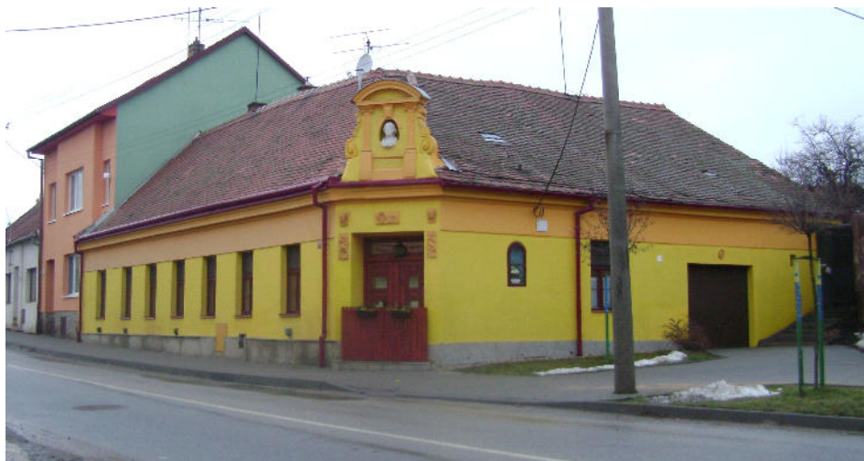
BUDOVA ŠEVČÍKOVA OBCHODU (ŽLUTÁ), VEDLE VLEVO BUDOVA POŠTY (ORANŽOVÁ).